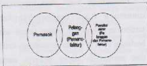
Gambar 5 : Hubungan Kontemporer: Rangkaian Pemasok- Pelanggan

produk sesuai dengan kehendak para pemakai akhir dan menghilangkan karakteristik yang tidak disukai oleh pelanggan. Oleh karena pamanufaktur memahami pelanggan dan kebutuhan mereka, maka ia dapat bekerja sama dengan pemasoknya untuk mendapatkan bantuan dalam usaha memenuhi kebutuhan tersebut.