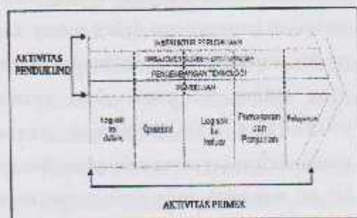
Gambar 3 : Aktivitas-Aktivitas Dalam Suatu Value Chain

Sumber : Porter, M.E. (1985), Competitive Strategy , New York: The Free Press, p.37