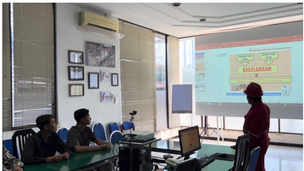
Gambar 3. 1 Presentasi K3 & Safety Induction menggunakan PPT

Video sering lebih mudah dibagikan secara online, sehingga dapat mencapai audiens yang lebih luas dan memungkinkan orang untuk melihatnya kapan saja. PowerPoint mungkin memerlukan dokumen tambahan atau penjelasan saat dibagikan.