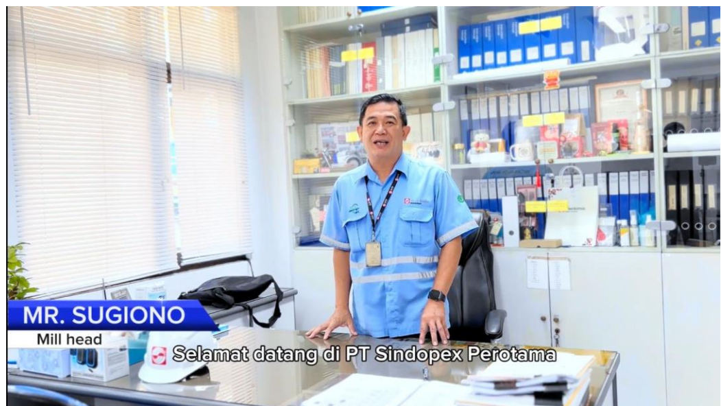
Gambar 3. 2 Tampilan video prosedur K3 & Safety Induction