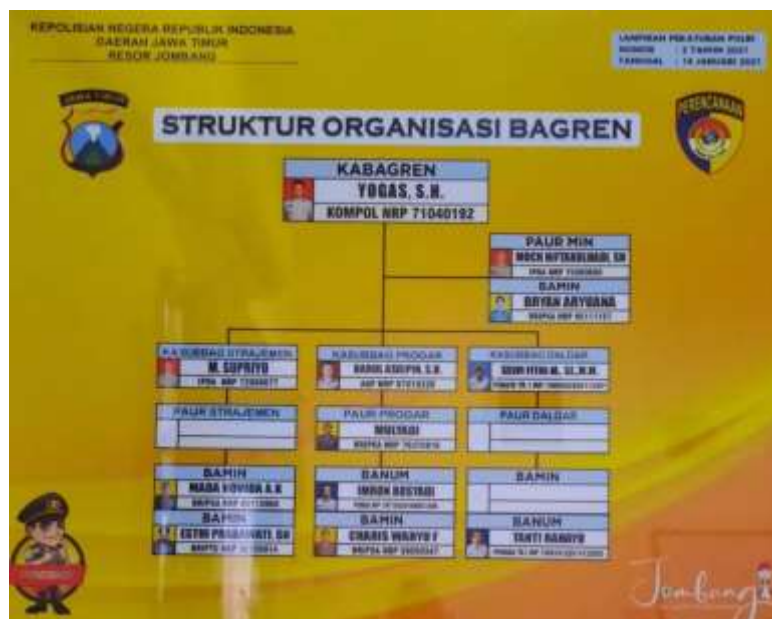
Gambar 2. 2 Struktur Organisasi Bargaen