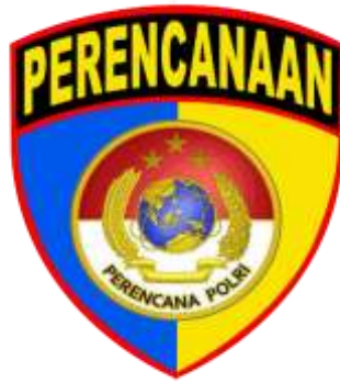
Gambar 2. 3 Perencanaan