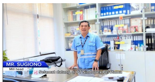
Gambar 3.2 Tampilan Prosedur Vidio Safety Induction

Dengan adanya hasil pengamatan tersebut, PT. SINDOPEX PEROTAMA mengubah penyampaian tentang Safety Indocution yang berawal dari sebuah Power Point menjadi bentuk video hal ini karena power point kurang efektif dilakukan karena mengganggu jam kerja karyawan dalam penyampaianya. Media video merupakan salah satu media sebagai alat bantu yang efektif dan optimal dalam proses menyapaikan system keselamatan dan kesehatan kerja di PT. SINDOPEX PEROTAMA. Kelebihan video di dalam multimedia adalah menjelaskan keadaan riil dari suatu proses; dapat memperkaya penyajian/penjelasan; pengguna dapat melakukan pengulangan (replay); sangat cocok untuk mengajarkan materi dalam ranah psikomotor (seperti praktikum); menunjukkan dengan jelas suatu langkah procedural (Munir, 2020). Dengan video ini tentang Safety Induction di PT. SINDOPEX PEROTAMA, berharap dapat mendorong setiap pekerja untuk mengambil peran aktif dalam menjaga keselamatan di tempat kerja. dan yakin bahwa video ini akan menjadi sumber referensi yang berharga bagi semua anggota tim, Semua sangat antusias untuk melihat dampak positif yang akan dihasilkannya dalam upaya menjaga keselamatan dan kesehatan kerja tim.