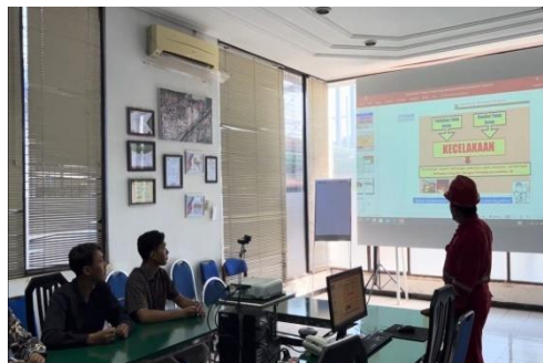
Gambar 3.1 Presentasi Safety Induction

Dalam presentasi PowerPoint, audiens mungkin cenderung terjebak dalam membaca slide atau merasa bosan jika pembicara tidak mempertahankan ketertarikan mereka. Video dapat lebih efektif dalam mempertahankan perhatian audiens karena alur cerita yang lebih baik.