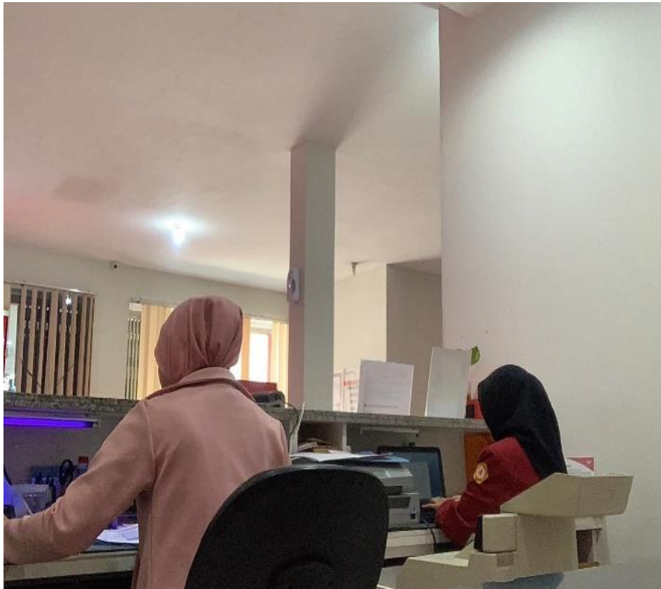
Membuat Akun Qris Nasabah Bank Jatim