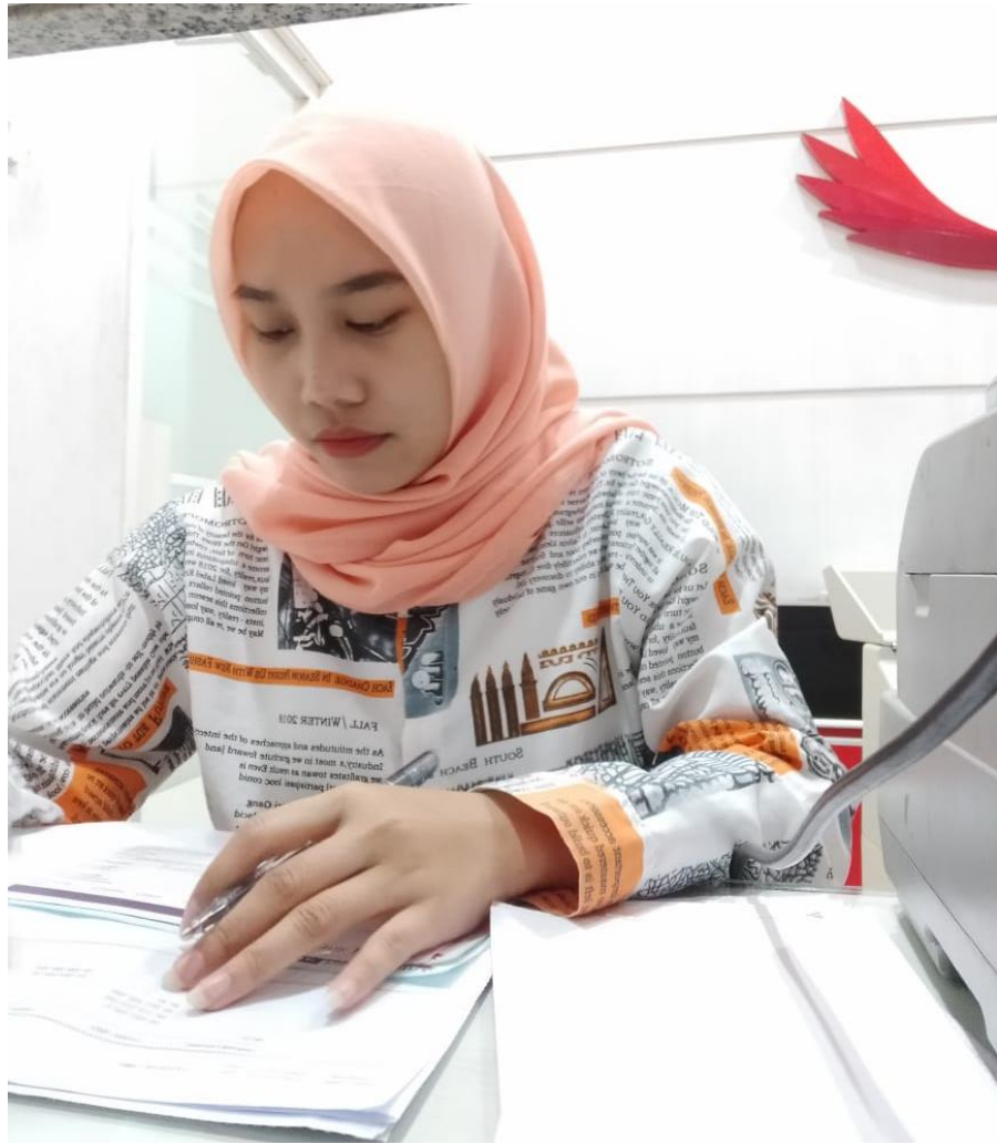
Pencatatan Register ATM