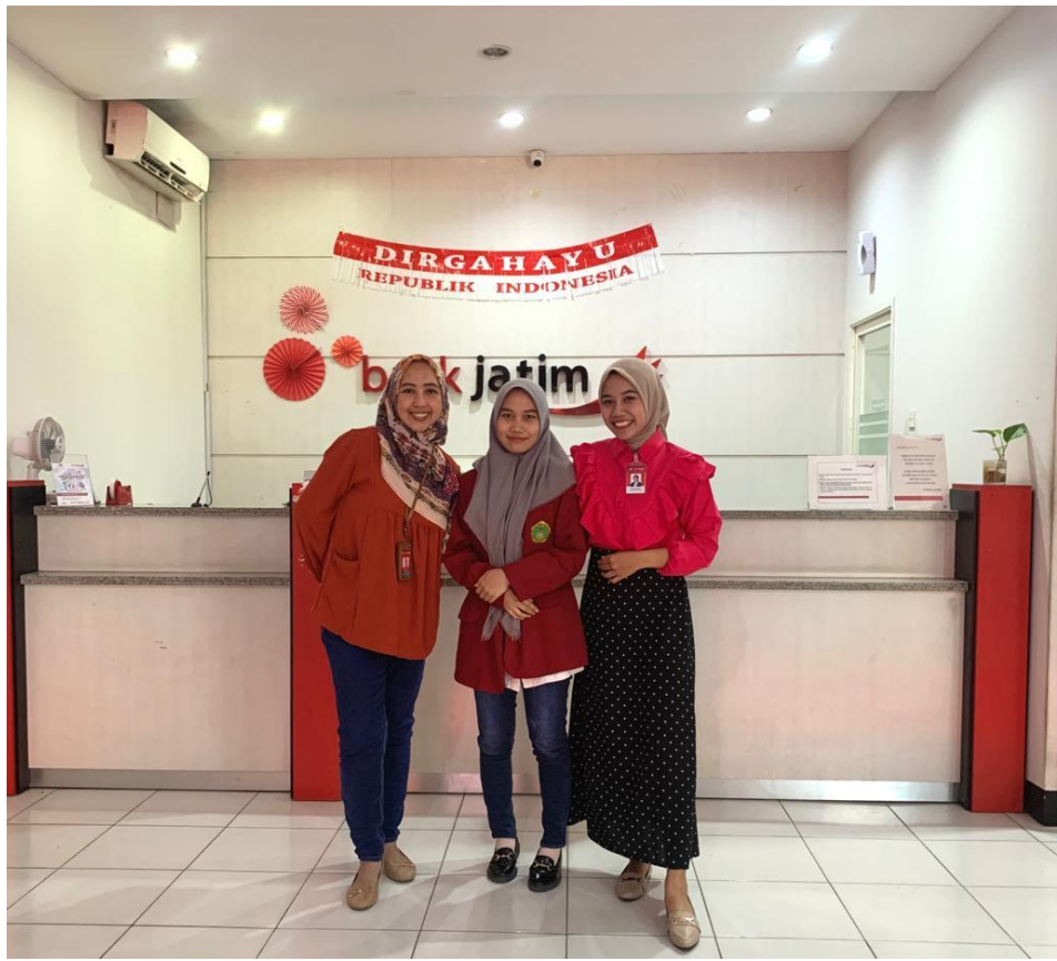
Foto Bersama Karyawan di Bank Jatim Kantor Kas Gudo