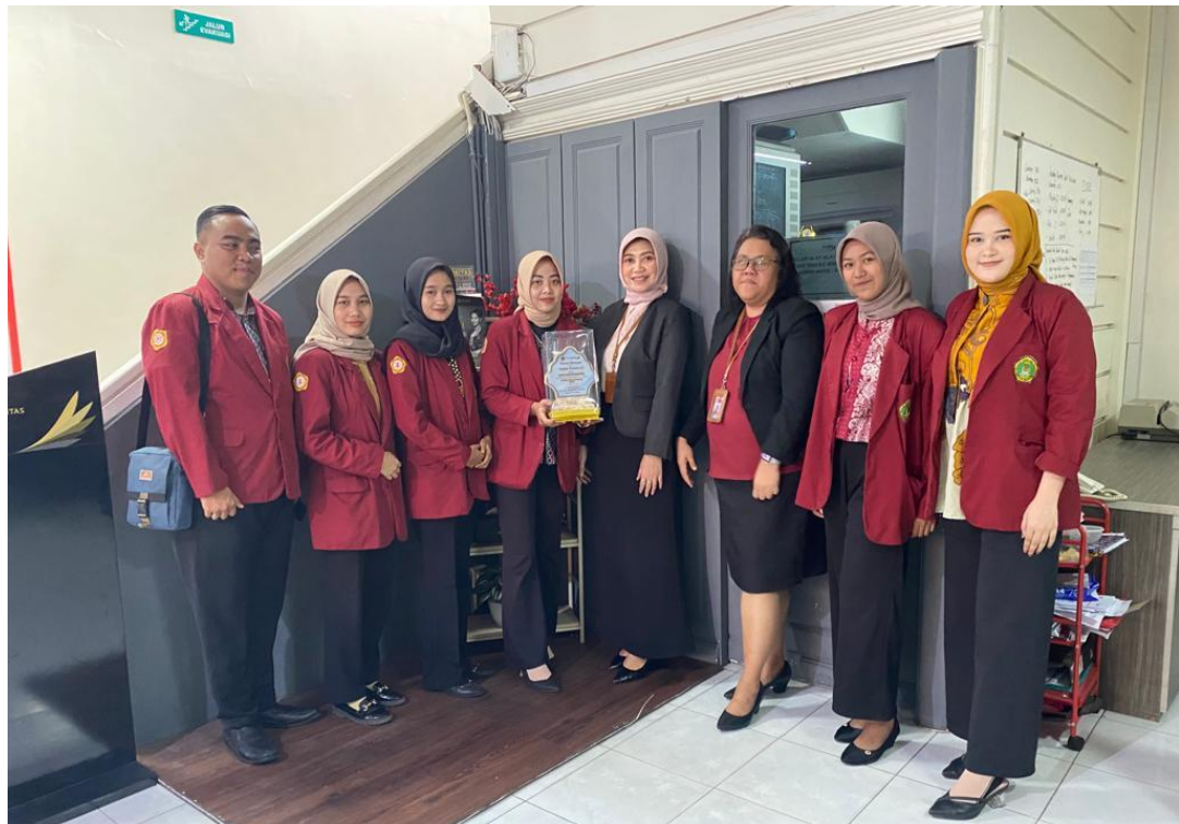
Perpisahan di Bank Jatim Cabang Jombang