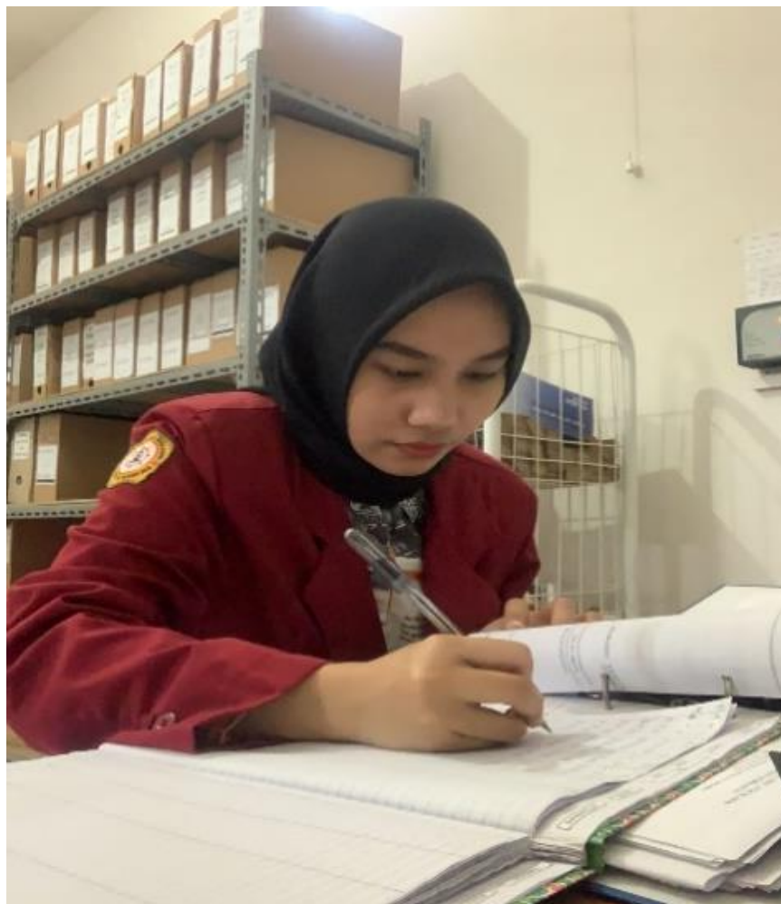
Pemberkasan file ATM, simpeda, simpanan pelajar, tabunganku, dan deposito