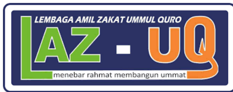
Gambar 2. 1 Logo Lembaga Amil Zakat Ummul Quro

Diawali dengan SK Pengukuhan Bupati Jombang tanggal 7 September 2002 No. 188/322/415.12/2002 sebagai Lembaga Amil Zakat Daerah, Kantor Zakat LPUQ senantiasa mengembangkan diri agar mampu memberikan pelayanan yang terbaik kepada masyarakat Jombang.