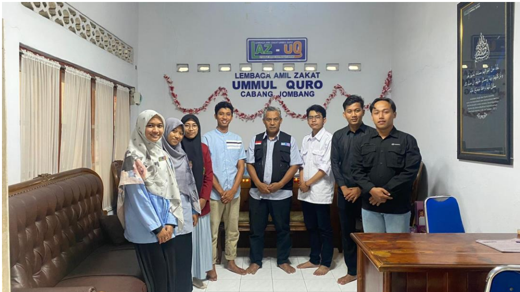
Foto Bersama Ketua Cabang Lazuq