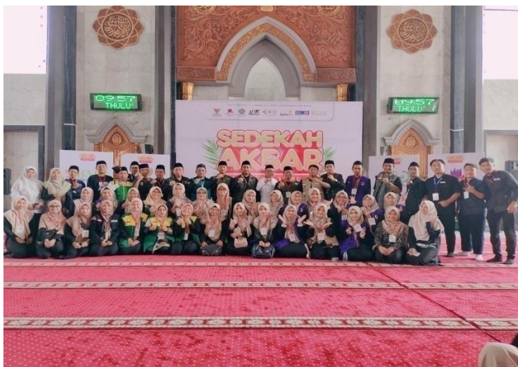
Foto Bersama Forsil Seluruh Lembaga di Jombang