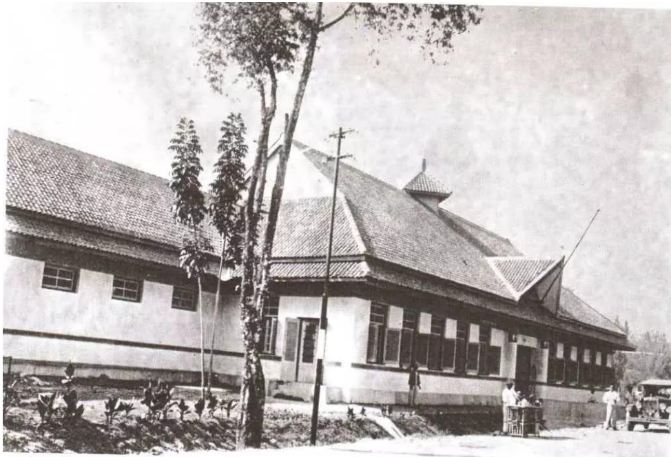
Gambar 2.1.1 Bangunan RSK Mojowarno Jaman Dahulu

Rumah Sakit Kristen Mojowarno didirikan dengan latar belakang pelayanan cinta kasih dari Gereja (Diakonia Gereja dari Greja Kristen Jawi Wetan) yang merupakan bagian dari kegiatan Greja Kristen Jawi Wetan pada umumnya.