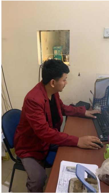
gambar 2 Dokumentasi Kegiatan Mahasiswa