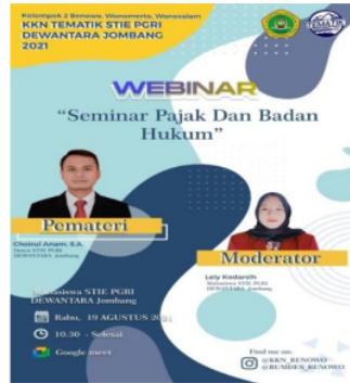
Gambar 1 Webinar Pajak dan Status Badan Hukum

Dari kegiatan yang sudah dilaksanakan diperoleh hasil yang memuaskan. Tim penulis beserta mahasiswa membuat program kerja Seminar pajak NPWP dan Status Badan Hukum Usaha serta pembuatan sosial media untuk BUMDes.