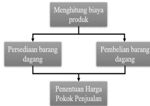
Gambar 2. Kerangka Penelitian

Harga pokok penjualan dalam penelitian ini ditentukan berdasarkan metode persediaan perpetual dan metode LIFO ( Last in First Out ) [15]. Penelitian ini bertujuan untuk membantu pemilik usaha dalam menentukan harga pokok penjualan yang tepat untuk usaha mikro Sepatu Thrift Singapura by Lix dan juga usaha mikro lainnya agar para pengusaha dapat menentukan strategi yang tepat dalam meningkatkan omset penjualan. Selanjutnya kerangka penelitian akan ditampilkan pada Gambar 2.