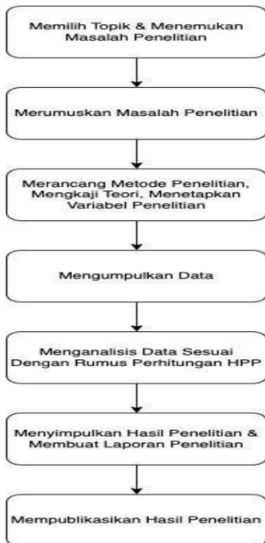
Gambar 3. Rancangan Penelitian

Analisis yang digunakan adalah analisis perhitungan ekonomi untuk memperoleh kelayakan harga pokok penjualan. Analisis ekonomi dilakukan dengan melihat persediaan barang dagangan, pembelian barang dagangan, beban angkut, return pembelian dan potongan pembelian, selanjutnya dilakukan dengan menghitung harga pokok penjualan yang layak untuk digunakan sehingga di tahun-tahun yang akan datang UMKM Sepatu Thrift Singapura by Lix dapat memprediksi harga pokok penjualan dengan baik untuk menghindari kerugian. Penelitian ini bermaksud untuk menyajikan data empiris mengenai selling cost, administrasi, biaya umum, serta HPP. Selanjutnya Rancangan Penelitian ditampilkan pada Gambar 3.