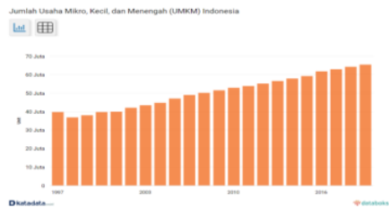
Gambar 1. Pertumbuhan UMKM di Indonesia dari Tahun 1997 hingga tahun 2019

Dunia usaha semakin berkembang pesat, beragam jenis usaha bermunculan salah satunya yaitu UMKM atau Usaha Mikro Kecil Menengah. Banyaknya pelaku usaha UMKM saat ini mengakibatkan ketatnya persaingan, hal ini mendorong pelaku UMKM untuk terus bertahan mengikuti perubahan zaman [1]. Peningkatan maupun penurunan pertumbuhan ekonomi di Indonesia dipengaruhi berbagai faktor, termasuk di dalamnya yaitu keterlibatan UMKM. Saat ini UMKM memegang peranan penting terhadap perekonomian daerah maupun nasional [2]. Selanjutnya pertumbuhan UMKM di Indonesia dari tahun 1997 hingga tahun 2019 ditampilkan pada Gambar 1.