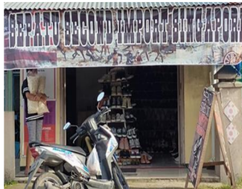
Gambar 4. Toko Offline UMKM Sepatu Thrift Singapura by Lix

UMKM ini membeli persediaan dari pemasok sepatu di Batam. Persediaan dijadikan sebagai salah satu bagian dalam pencatatan laporan keuangan yang dapat menunjukkan situasi atas produk dagangan dalam sebuah UMKM [24]. Bentuk pembelian berupa bal, dengan total 100 pasang sepatu dalam satu bal. Selama satu tahun berjalan, usaha ini sudah mampu menjual sebanyak 332 pasang sepatu dari 600 pasang pembelian yang dilakukan. Pencatatan persediaan dilakukan oleh pemilik dengan sistem perpetual yaitu tiap satu bulan sekali. Selanjutnya Toko Offline UMKM Sepatu Thrift Singapura by Lix ditampilkan pada Gambar 4.