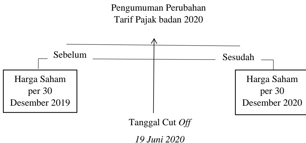
Gambar 2. 2 Kerangka Pemikiran

Kerangka pemikiran merupakan model konseptual yang menggambarkan secara spesifik hubungan antar variabel-variabel yang dipakai dalam penelitian. Dalam penelitian ini, judul yang dipakai adalah Analisis Harga Saham Perusahaan yang Terdaftar di BEI Sebelum dan Sesudah Perubahan Tarif Pajak Badan. Dimana variabel dependen yang digunakan adalah harga saham (Y) sedangkan variabel independen yang digunakan adalah perubahan tarif pajak badan 2020 (X). secara sistematis, kerangka pemikiran dalam penelitian ini dapat digambarkan sebagai berikut: