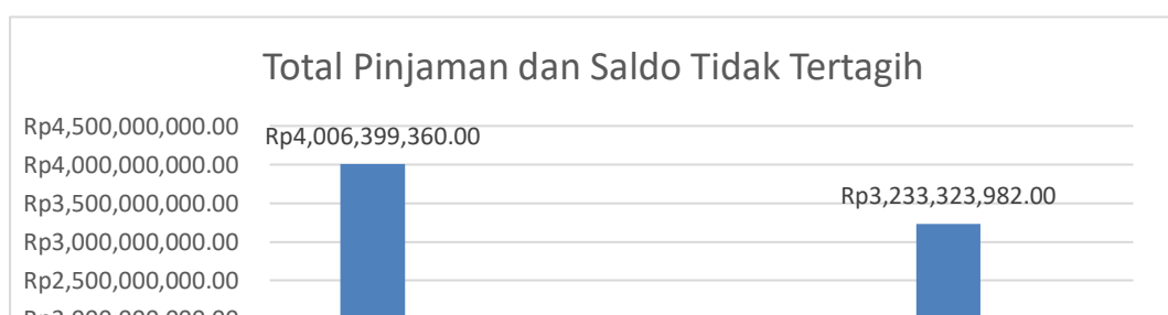
Grafik 1.2 Total Pinjaman dan saldo Tak Tertagih

Berdasarkan table diatas jumlah kreditur Koperasi Sari Hasanah tahun 2019 mencapai 1518 nasabah, tahun 2020 sebanyak 1427 nasabah dan tahun 2021 meningkat sebanyak 1598 nasabah, sedangkan jumlah kreditur tak tertagih tahun 2019 sebanyak 175 nasabah, tahun 2020 sebanyak 172 nasabah dan tahun 2021 sebanyak 225 nasabah.