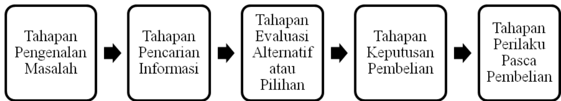
Gambar 2.1 Tahap Proses Pengambilan Keputusan Konsumen

Berdasarkan gambar di atas menunjukkan bahwa proses pembelian Konsumen melalui lima tahap: Pengenalan masalah, pencarian informasi, evaluasi alternatif, keputusan pembelian, dan perilaku pasca pembelian. Jelaslah bahwa proses pembelian dimulai jauh sebelum pembelian aktual dilakukan dan memiliki dampak yang lama setelah itu. Dibawah ini akan diuraikan lebih lanjut mengenai proses keputusan pembelian. Dilihat secara umum bahwa konsumen memiliki 5 (lima) tahap untuk mencapai suatu keputusan pembelian dan hasilnya (Kotler dan Keller, 2012), yaitu: