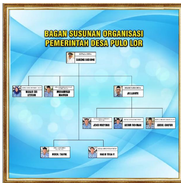
Gambar 2.2.1 Susunan Organisasi PEMDES Pulo Lor

Dalam susunan organisasi Pemerintah Desa Pulo Lor secara struktural terdiri dari kepala desa, sekretaris desa, kepala seksi pemerintahan, kepala urusan keuangan, kepala urusan perencanaan, kepala urusan umum, kepala dusun pulo wetan, kepala dusun pulo kalimalang, kepala seksi kesejahteraan rakyat dan pelayanan serta staf operator desa.