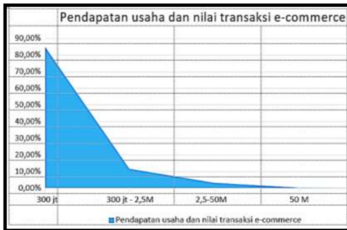
*gambar A.3 adalah ilustrasi Pendapatan usaha dan nilai transaksi e-commerce

Nilai pendapatan usaha e-commerce merupakan pendapatan total usaha selama tahun 2018 yang didapatkan dari hasil penjualan baik melalui e-commerce maupun bukan e-commerce. Dari hasil profil usaha e-commerce dapat dilihat bahwa sebagian besar usaha e-commerce merupakan usaha dengan pendapatan per tahun kurang dari 300 juta rupiah dengan jumlah proporsi usaha sebanyak 84,84 persen dari keseluruhan usaha e-commerce yang menjadi sampel survei. Kemudian diikuti oleh usaha dengan pendapatan antara 300 juta–2,5 miliar rupiah sebanyak 11,72 persen, usaha dengan pendapatan sebanyak 2,5–50 miliar sebanyak 3,15 persen dan terkecil pada usaha dengan pendapatan sebanyak lebih dari 50 miliar rupiah sebanyak 0,29 persen. 16