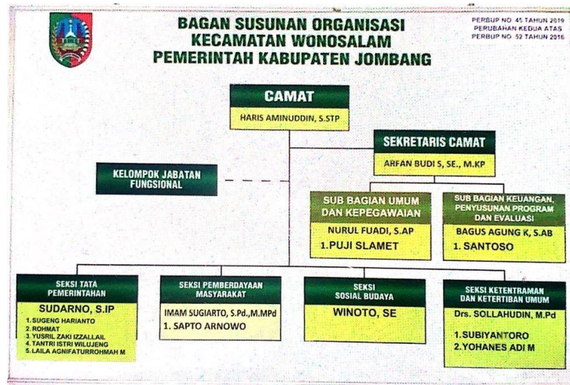
Gambar 2.1 Struktur Organisasi