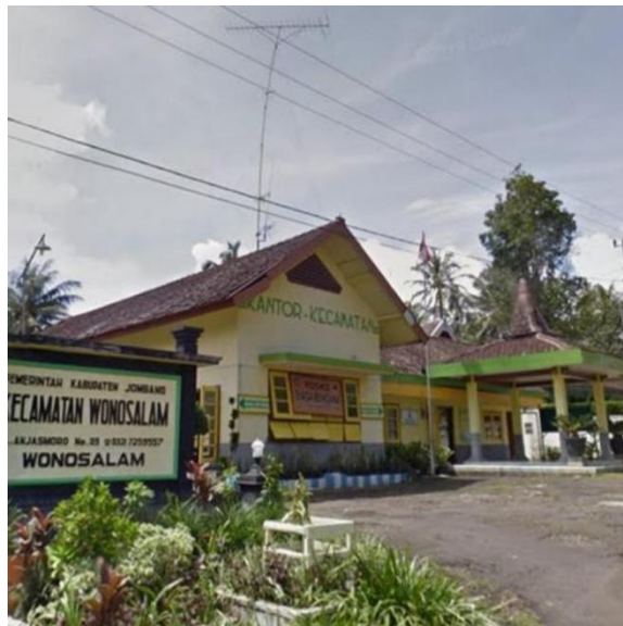
Gambar 1.1 Lokasi Tempat Magang

Kegiatan Kuliah Kerja Magang (KKM) ini dilaksanakan di Kantor Kecamatan Wonosalam yang terletak di Jl. Anjasmoro No 03 Desa Notorejo, Kecamatan Wonosalam, Kabupaten Jombang, Jawa Timur 61476 Kabupaten Jombang, Jawa Timur.