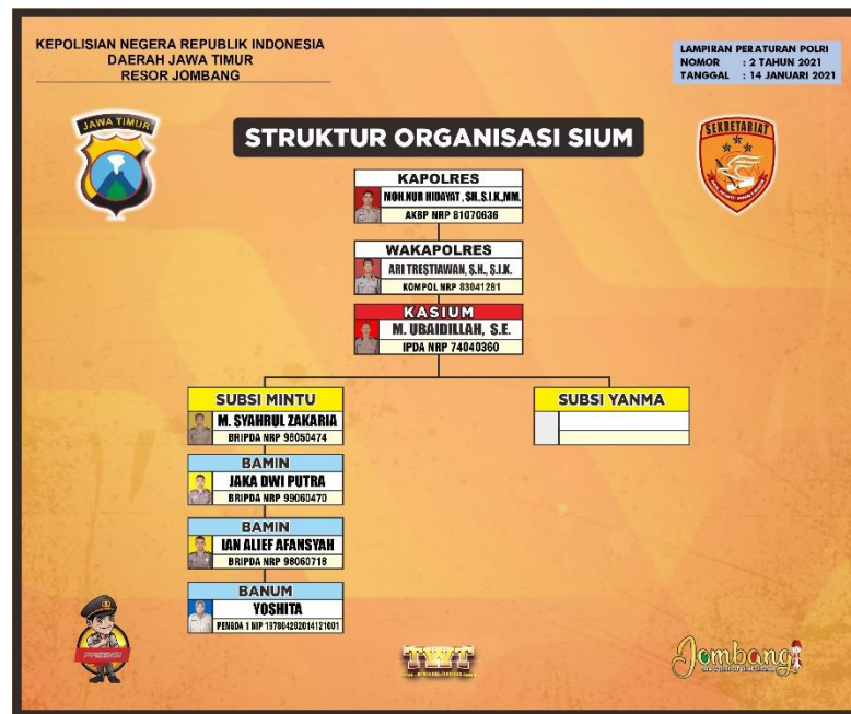
Gambar 2.2 1 Struktur Organisasi Bagian SIUM