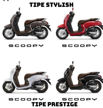
Gambar 2.2 Produk Scoopy