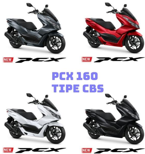
Gambar 2.4 PCX 160