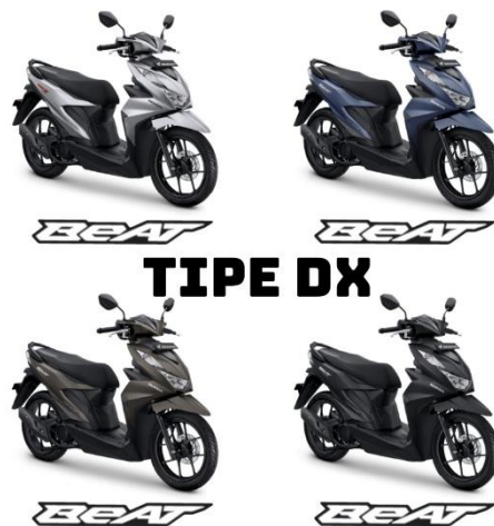
Gambar 2.1 Produk Motor Beat