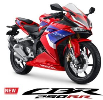
Produk CBR 250