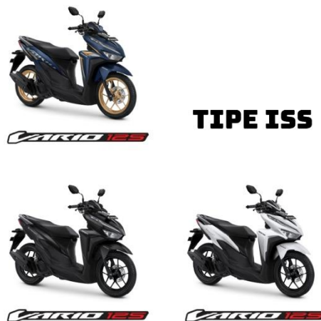
Produk Vario 125