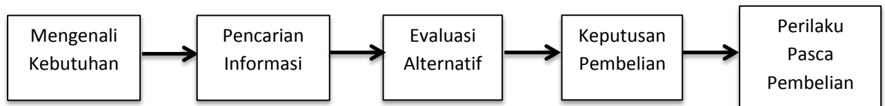
Gambar 2.1 Lima Tahap Proses Keputusan Pembelian

aktual dilakukan dan memiliki dampak yang lama setelah itu. Namun para konsumen tidak selalu melewati seluruh lima urutan tahap ketika membeli produk, mereka bisa melewati atau membalik beberapa tahap. Gambar berikut ini mengilustrasikan proses tersebut.