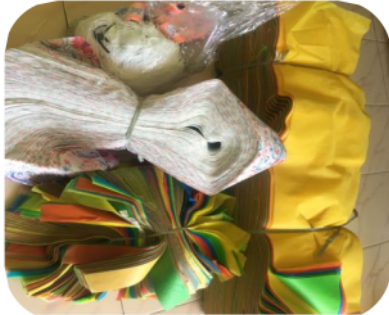
Gambar 4 : Produk Usaha Informan 3

Karyawan : 17 Orang Jangkauan Pemasaran : Luar Kota dan Lokal (dalam Kabupaten) Omset : 120 juta/bulan