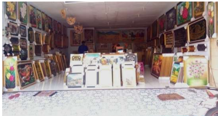
Gambar 1.1 Foto Galeri Arfi

lukisan, kaligrafi. Galeri Arfi terletak di pusat kota Kediri tepatnya di Jl. Pattimura No. 99 Kota Kediri. Kelengkapan akan produknya digerei Galeri Arfi, akan membuat sebuah persepsi ketika konsumen membutuhkan produk untuk hiasan rumah mereka maka akan berbelanja di gerai tersebut. Strategi yang diterapkan oleh Galeri Arfi harus tepat sesuai sasaran, sehingga mampu untuk berkembang dan bersaing di tengah persaingan yang ketat saat ini. Produk yang dijual Galeri Arfi juga bermacam-macam, antara lain: bingkai foto, lukisan, dan segala bentuk dan ukuran kaligrafi. Selain dari faktor barang yang di perdagangkan, faktor lain yang harus di perhatikan adalah penataan barang pada gerai tersebut.